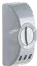
Надежное механическое управление